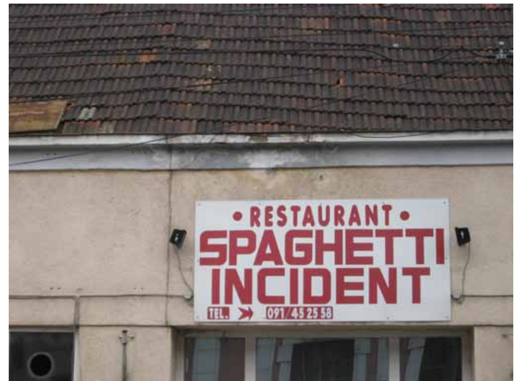
TIMIȘOARA, 2008