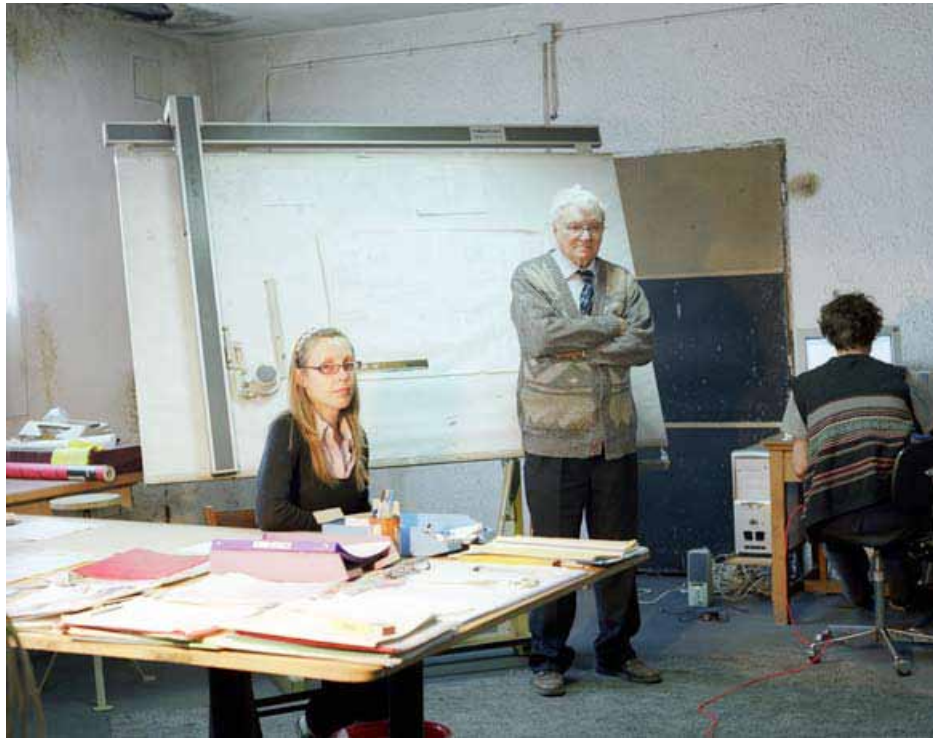
STUDIO DELLA FABBRICA DI MULINI ROSSI, TIMIȘOARA, 2008