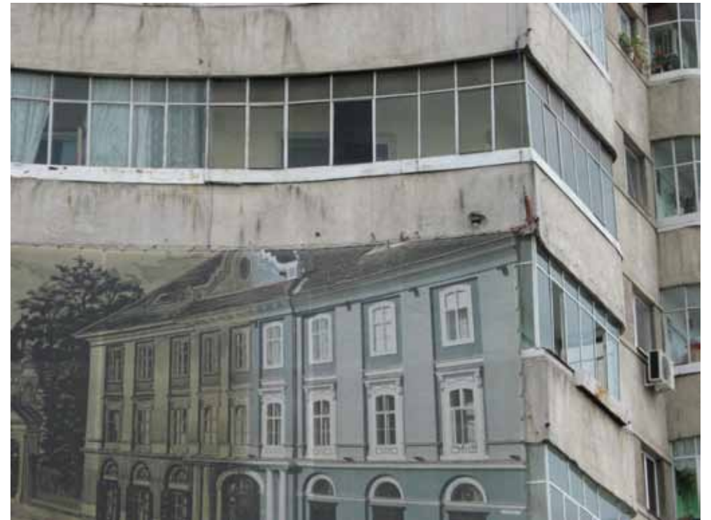
TIMIȘOARA, 2008