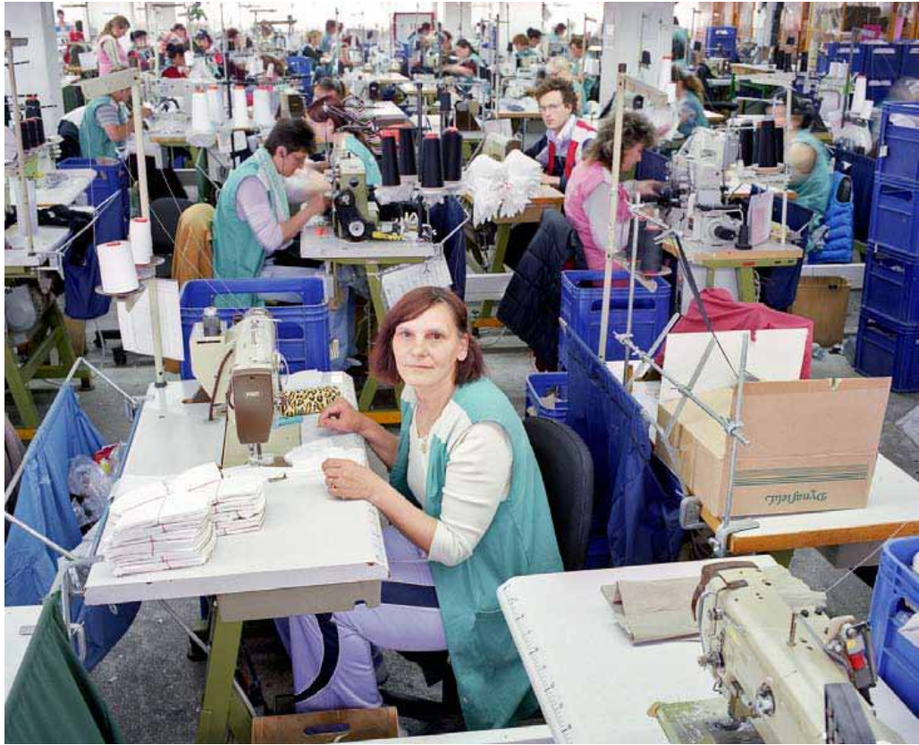
FABBRICA DI BIANCHERIA PASMATEX , TIMIȘOARA, 2008