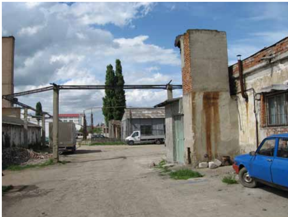
ZONA INDUSTRIALE, FABBRICA DI MULINI ROSSI, TIMIȘOARA, 2008