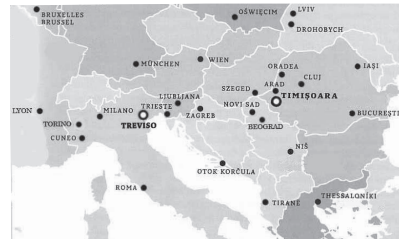
SORGENTE : GOUZ A., 2008, FABRIQUES DE L'EUROPE , FILIGRANES EDITIONS

Questo studio etnografico si apre con l'analisi del "mito del Nord Est" attraverso gli scritti dei federalisti italiani e le denunce degli autori di romanzi gialli, influenzati dal movimento di contestazione degli anni '70. Prosegue con uno sguardo al trascorso dei legami economici e culturali tra la Romania e l'Italia, e, si conclude, inquadrando gli aspetti più preoccupanti delle delocalizzazioni competitive attuali: principalmente la mancanza di riconoscenza di cui soffrono i lavoratori rumeni nelle unità di produzione straniera, la mercificazione delle donne, che non è unicamente riconducibile alla prostituzione, ma ingloba anche tutta una serie di compiti domestici oggi esternalizzati. Infine, lo sviluppo dell'industria di trattamento dei rifiuti, in un Paese in cui le strutture appropriate sono inadeguate o carenti, e dove la vaghezza giuridica provocata dalle riforme in corso e la corruzione delle élites, lasciano intuire molte minacce.